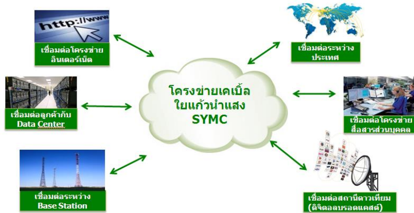
การใช้ประโยชน์จากโครงข่ายเคเบิลใยแก้วนำแสง

รายอื่น เช่น ผู้ให้บริการโทรศัพท์ระบบ 3G การแพร่ภาพกระจายเสียงแบบดิจิทัลบรอดแคสต์ เป็นต้น โดยสามารถจัดการให้บริการอย่างมีประสิทธิภาพ ตามความเหมาะสมในแต่ละธุรกิจของผู้ใช้บริการ (Customization) ด้วยทีมงานผู้เชี่ยวชาญที่มีความรู้ความสามารถ และประสบการณ์สูง มีการควบคุมการทำงานด้วยระบบคอมพิวเตอร์ทำให้สามารถตรวจสอบเหตุขัดข้องให้ผู้ให้บริการได้อย่างรวดเร็ว